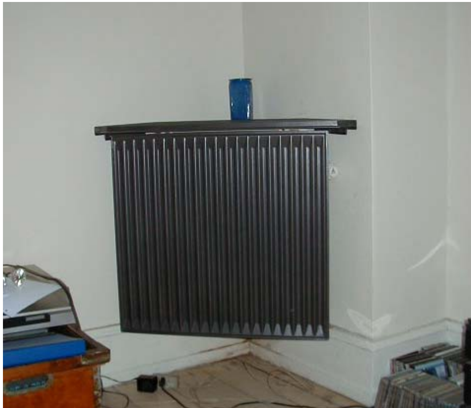
”Den nye kakkelovnskrog” i Absalonsgade 24.

Udgangspunktet var dels de skæmmende radiatorer og varmerør foran ofte fine vinduespaneler, som man ser ved nyetablerede centralvarmeanlæg i ældre ejendomme, dels de problemer ventilationsanlæg giver med træk, støj og højt energiforbrug.