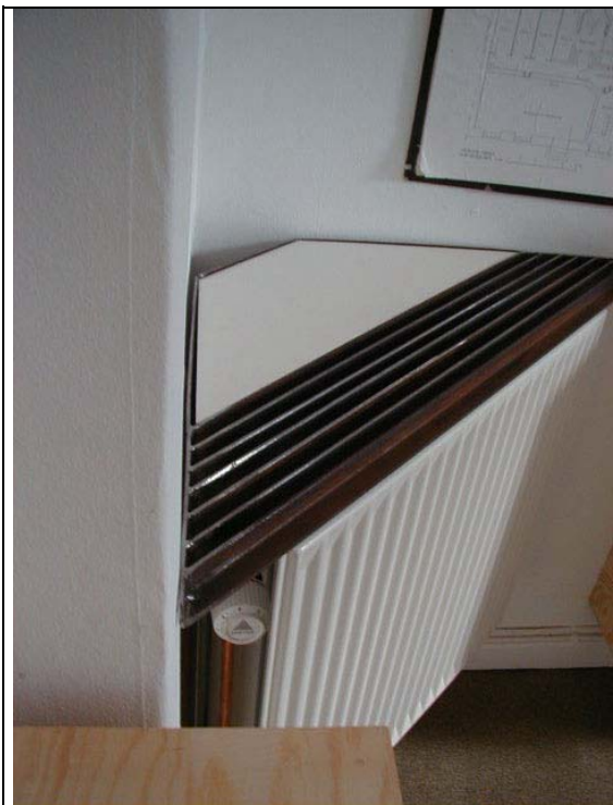
Radiatorprøve med rist.