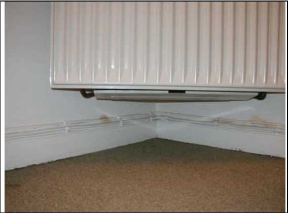
Bund af prøveradiator.