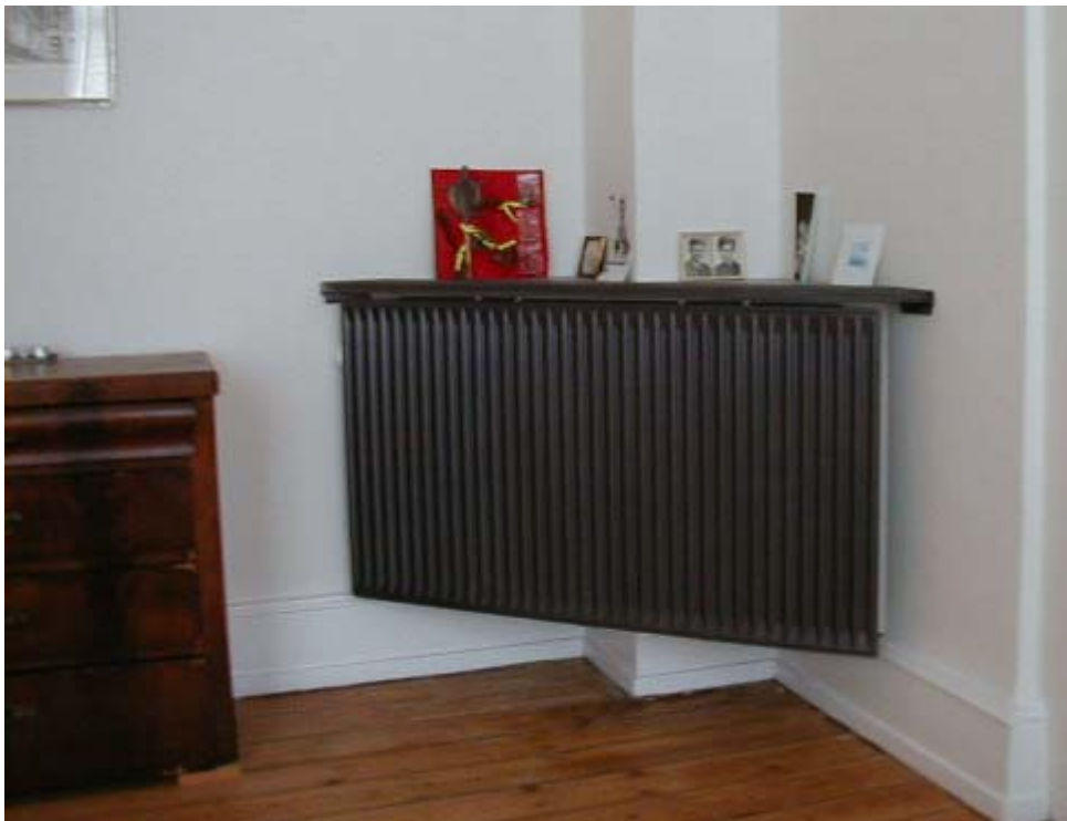
Type B: udadgående hjørne i stor stue: (Radiator: Rio PK II x 655 x (1000/1200):