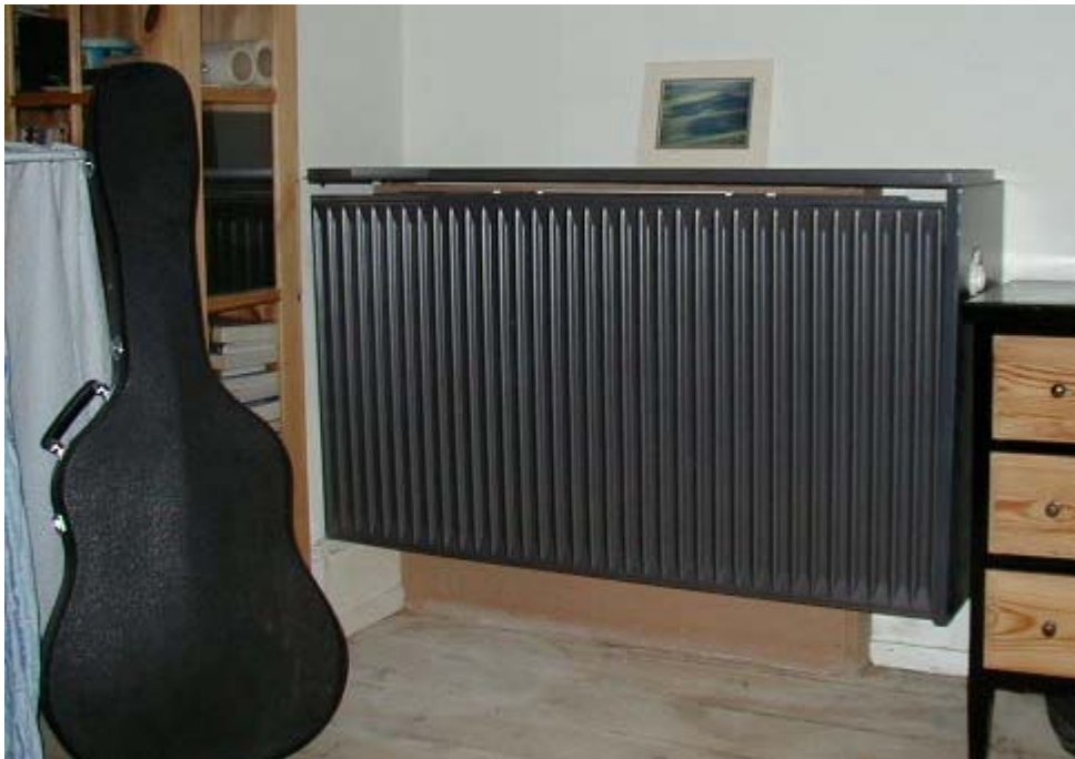
Type C1: Ophæng på lige væg: stor i lejlighed 1. tv, hvor væg var nedrevet: Rio PK III x 655 x (100/1200)