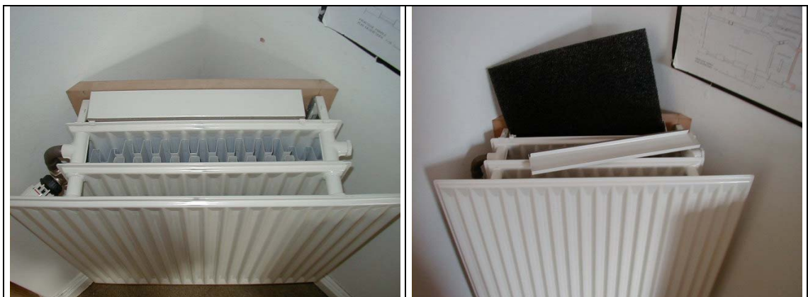
Prøveradiator uden rist.

Fabrikken havde sammen med et svensk firma et produkt der styrede friskluftindtag gennem facaden bag radiatoren, når denne er ophængt på udvendig væg under et vindue. Dette ventilationssystem viste sig uden større ændringer at kunne bruges, som kobling mellem ventilationen friskluft tilførslen gennem skorstenen – og radiatoren.