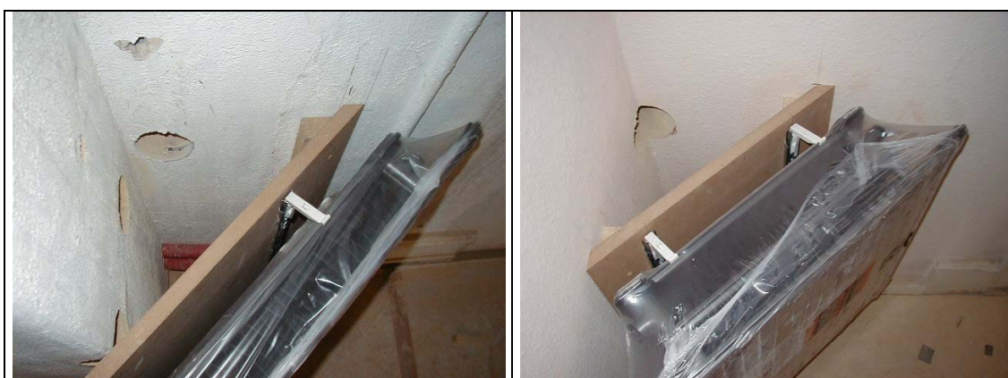
Radiator type B

Efter foringen bores huller i skorstenen og ventilation og varmerør kunne kobles til når radiator ophængtes.