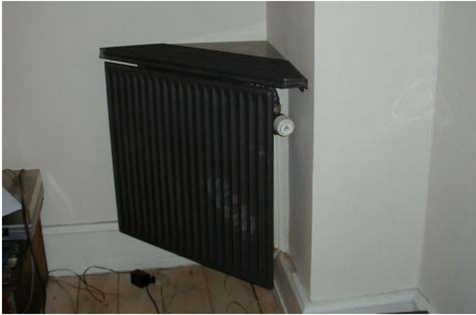
Type A: indadgående hjørne: (Radiator: Rio PK III x 655 x (500/700))