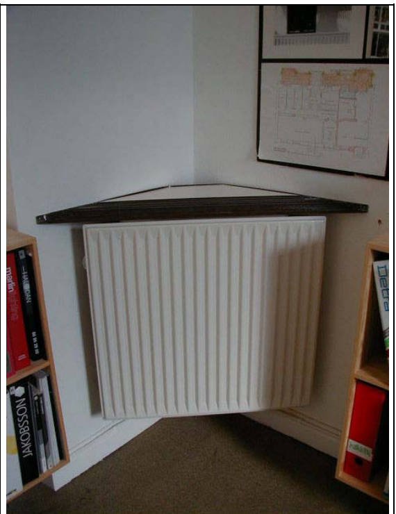
Radiatorprøve med rist.

Det viste sig ved detailprojekteringen, at det var nødvendigt at kunne ophænge radiatoren på plan væg også. At det var nødvendigt at udvikle et design på en type radiator, der ikke hang i et hjørne, men på en plan væg. Man valgte at bruge samme type radiator, med forlænget forplade, og så designe specielle "gavle" og rist til at inddække radiatoren.