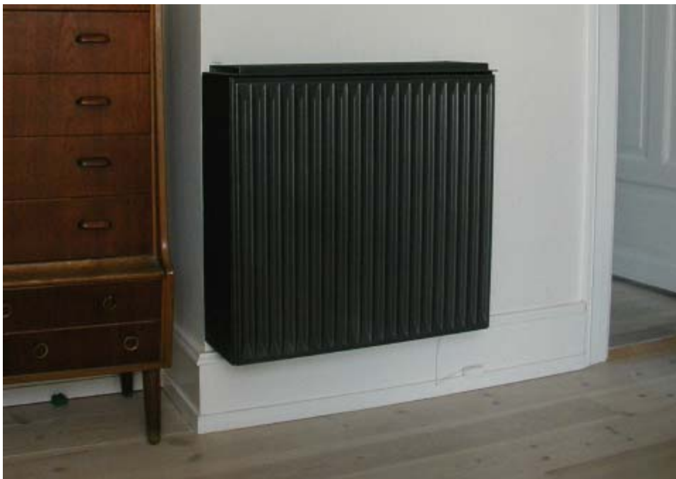
Type C2: Ophæng på lige væg: mindre i tagboligers stue med lige væg ved skorsten men samme størrelse som i små værelser i stuer nedenunder: Rio PK III x 655 x(500/700)

Radiatornavnet betyder, at det er en Rio radiator, type PK med 1, 2 eller 3 plader (I, II, III). 655 angiver radiatorens højde i mm. Tallene i parentes angiver bagpladernes henholdsvis forpladens bredde i mm.