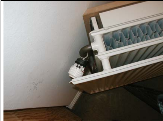
Ventil på radiatorprøve

Der udførtes en prøve som blev ophængt primært for at afprøve det visuelle design. Forskellige riste blev afprøvet. Prøven viste at den forlængede forplade uden problemer skjulte radiatorens termostatventil, selvom den monteredes på traditionel vis og uden det gik ud over betjeningen. Derfor var det ikke nødvendigt at udforme speciel termostatventil eller betjeningspanel, som ville fordyre radiatoren.